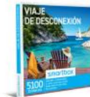
200 puntos PACK OCIO- 2 DÍAS DE EVASIÓN