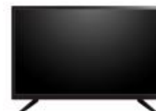
200 puntos TELEVISOR 50"