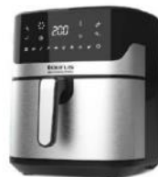
FREIDORA DE AIRE