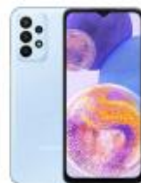
200 puntos SMARTPHONE SAMSUNG