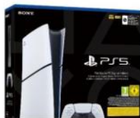
PS5 SLIM DIGITAL