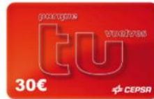
TARJETA CEPESA DIGITAL 30€ 30 puntos