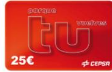
TARJETA CEPESA DIGITAL 25€ 25 puntos