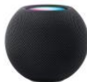
200 puntos HOMEPOD MINI - APPLE