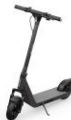
200 puntos PATINETE ELÉCTRICO