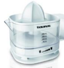
EXPRIMIDOR 33 puntos