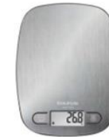
BALANZA DE COCINA 35 puntos