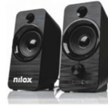
ALTAVOCES 26 puntos