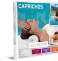
PAQUETE OCIO: CAPRICHOS 28 puntos